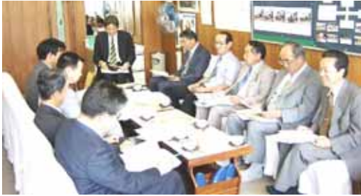
【栗橋町校長会での説明】

まちネットでは、栗橋町教育委員会の承諾を頂き、7月1日に同町の西小学校で行われた校長会で、社会教育推進分野を中心に活動状況を説明させて頂きました。説明の目的は、行政・企業・NPOによる学習協働事業の拡充にあります。同会議には、同町の小中学校長と教育委員会次長、学校教育課長の皆さんが出席されました。席上、まちネットからは、これまでに行ってきた市民を対象とした循環型社会や高齢化社会・